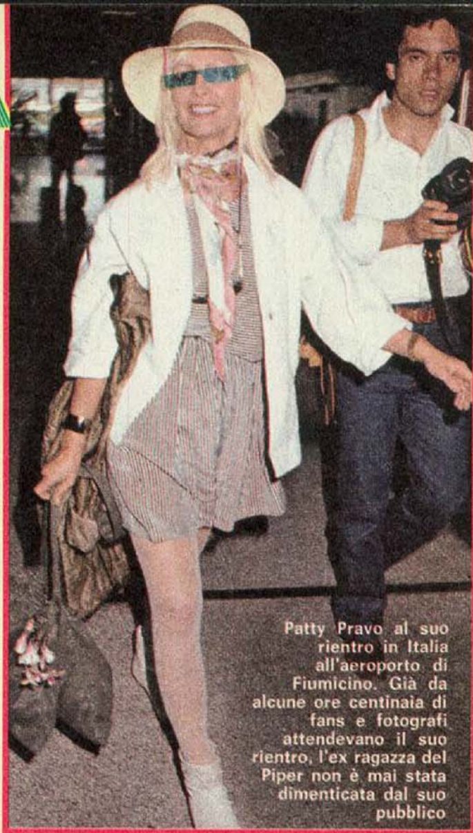
Patty Pravo al suo rientro in Italia all'aeroporto di Fiumicino. Già da alcune ore centinaia di fans e fotografi attendevano il suo rientro, l'ex ragazza del Piper non è mai stata dimenticata dal suo pubblico