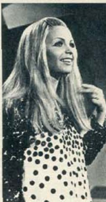
Patty Pravo, la estrella del «show» para fin de año de la televisión francesa.

PATTY PRAVO será la estrella de la pequeña pantalla para el «show» montado por la televisión francesa para fin de año.