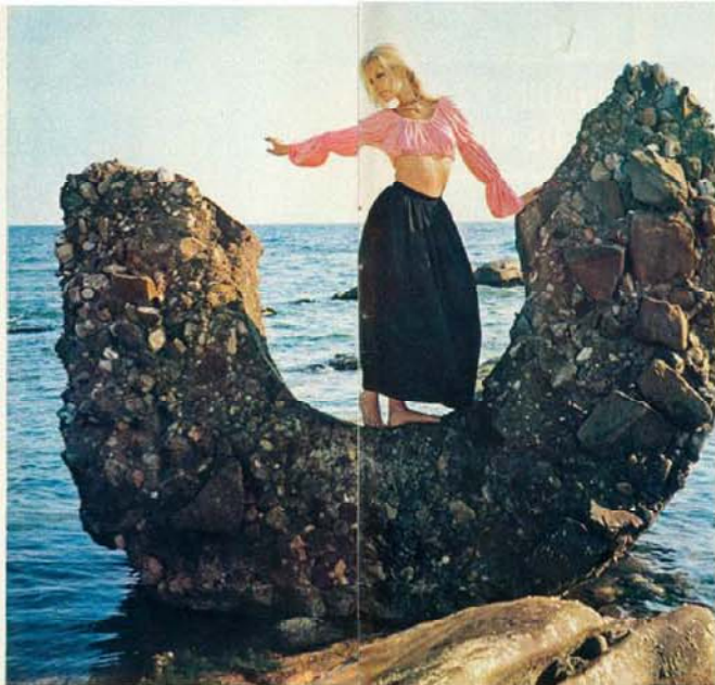
El estilo y la figura delicadísima de Patty Pravo es lo que ha seducido al realizador Averty a grabar el programa televisivo con la sola presencia de la bella cantante.